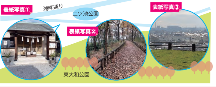
表紙写真① 湖畔通り 表紙写真② ニツ池公園 表紙写真③ 東大和公園

行ってみました ~都立東大和公園周辺~ 今回は都立東大和公園とその周辺です。ニツ池公園を上にあがると、「出雲大社武蔵野 未来講社」という神社がありました。東大和公園正門から入ると3ルートあり、今回は真ん中のルート、「源流の森・団地口」へ。公園というより結構森な感じ。自分の落ち葉を踏む足音と鳥の声だけで、ちょっとドキドキ…。分かれ道がいくつかあり、それぞれに案内板があるので安心してハイキングできます。幼稚園口から道路に出ると、東大和の街並みが一望出来るような景色が見られました。他のルートも楽しそうです。