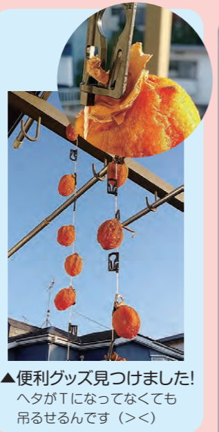
▲便利グッズを見つけました！ ヘタがTになってなくても吊るせるんです (><)

行ってみました ~都立東大和公園周辺~ 今回は都立東大和公園とその周辺です。ニツ池公園を上にあがると、「出雲大社武蔵野 未来講社」という神社がありました。東大和公園正門から入ると3ルートあり、今回は真ん中のルート、「源流の森・団地口」へ。公園というより結構森な感じ。自分の落ち葉を踏む足音と鳥の声だけで、ちょっとドキドキ…。分かれ道がいくつかあり、それぞれに案内板があるので安心してハイキングできます。幼稚園口から道路に出ると、東大和の街並みが一望出来るような景色が見られました。他のルートも楽しそうです。