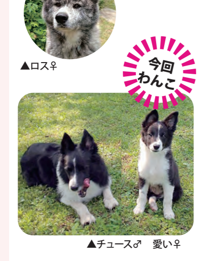
▲ロス♀ ▲チユース♂ 愛い♀